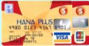
HANA PLUS カード