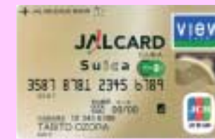
JAL カード Suica