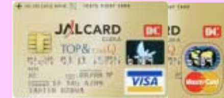
JAL カード TOP&ClubQ (3月中旬募集開始予定)