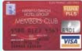
阪急第一ホテルグループ HANA PLUS VISA カード