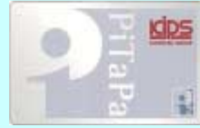
KIPS PiTaPa カード