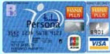
ペルソナ HANA PLUS カード