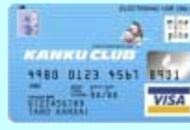
KANKU CLUB カード