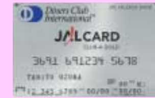
JAL・ダイナースカード