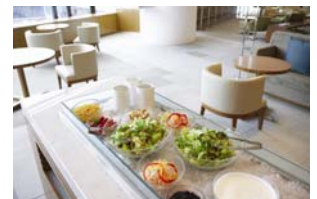
【THE DINING サラダバー】

リラクゼーションコーナーでは、全身に心地よく降り注ぐシャワールームやマッサージチェアをご準備しております。また専門スタッフによるボディーマッサージ、足つぼマッサージ等をご利用いただくことができます。