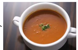
【Soup Stock Tokyoの暖かいスープ】