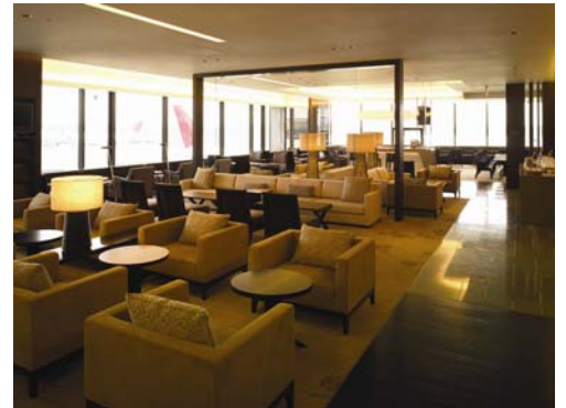
【JALファーストクラスラウンジ】

日本最大、総床面積約4,000平方メートルの広さを誇るラウンジです。これまでのラウンジの約2.7倍の空間にファーストクラスラウンジに161席、サクララウンジに507席をご準備しゆったりとした空間を演出いたしました。