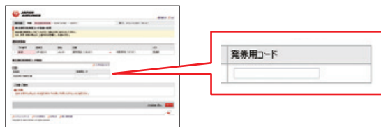
[発券用コード登録画面]