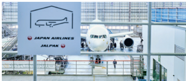
羽田格納庫見学会（イメージ写真）

https://www.jal.com/ja/investor/individual/event/