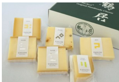
「ナチュラルチーズ鶴居(鶴居チーズセット)」