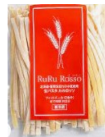
「生パスタ ルルロッソ フィットチーネ」

航空輸送ならではのスピードと細やかな対応で、各地自慢の果物や朝とれ野菜などをお届けするほか、東京の店舗販売では滅多に流通することのないプリンやゼリーといった生菓子やチーズ、道産品をふんだんに使ったレトルトのカレーやスープなどの北海道の名産品が集結します。また当日は、北海道の「JAL ふるさと応援隊」(*)の客室乗務員も「2021 年秋の大北海道展」で商品の PR をします。