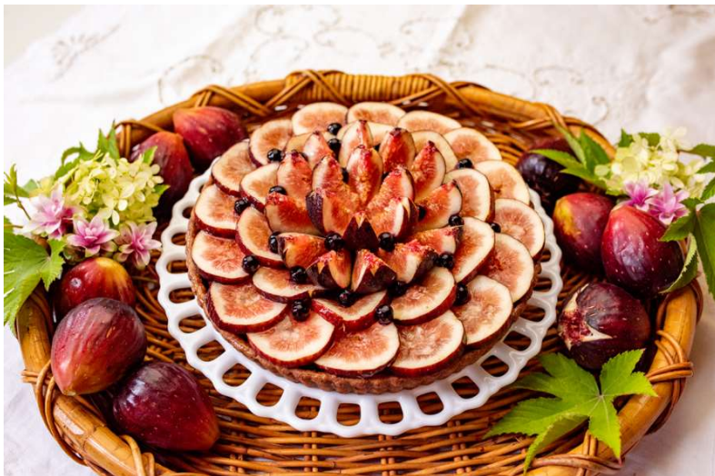
兵庫県川西産いちじく「朝採りの恵み」とチョコレートクリームタルト

※毎朝その日に採れたものを販売します。日によっていちじくの納品時間が異なるため、キルフェボン公式Facebookにて日々販売時刻をお知らせします。